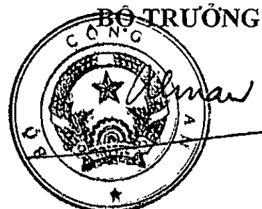
Thượng tướng Lương Tam Quang