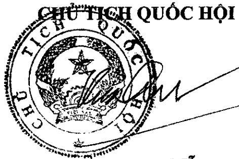
Trần Thanh Mẫn

Nghị quyết này được Quốc hội nước Cộng hòa xã hội chủ nghĩa Việt Nam khóa XV, Kỳ họp bất thường lần thứ 9, thông qua ngày 18 tháng 02 năm 2025.